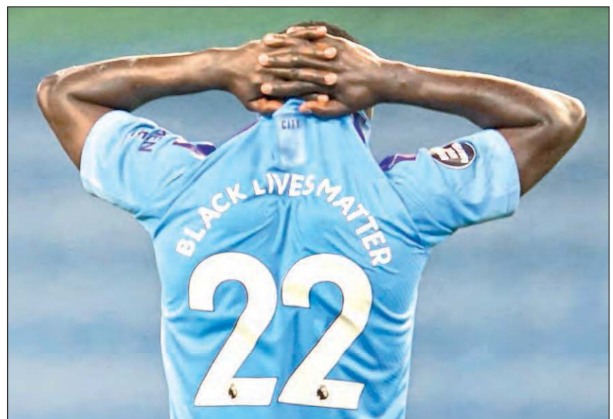
বর্ণবিদ্বেষ বিরোধী জার্সি পরে ম্যাঞ্চেস্টার সিটির ফুটবলার বেঞ্জামিন মেডি।