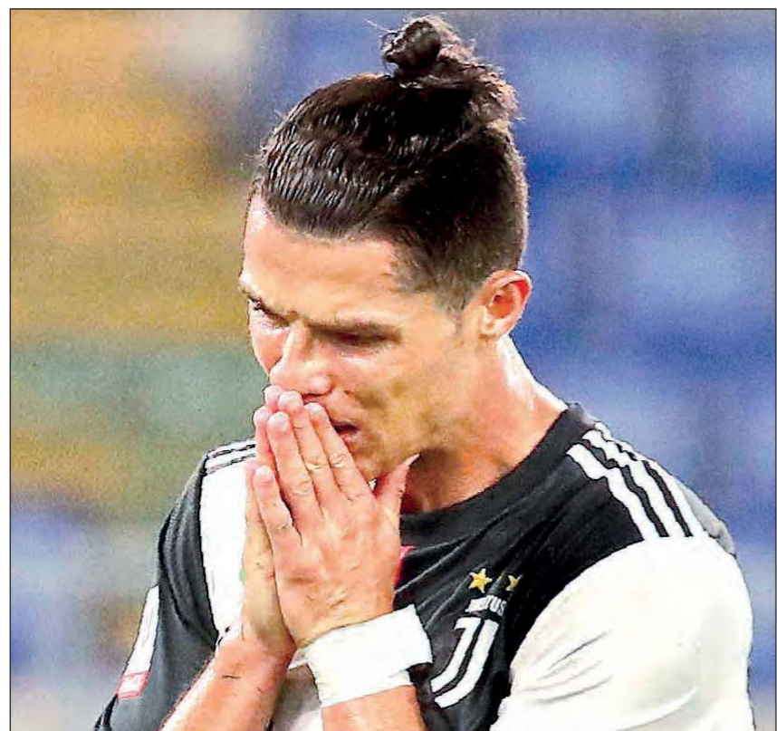
সুযোগ নষ্ট করে হতাশ রোনাল্ডো। কোপা ইতালিয়ার ফাইনালে, বুধবার।